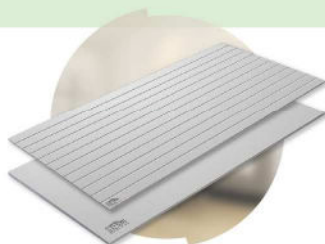
ผนังสมาร์ทบอร์ด เอสซีจี SCG SmartBOARD